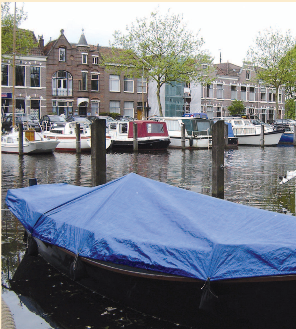
De Haven zoals die er nu uitziet.